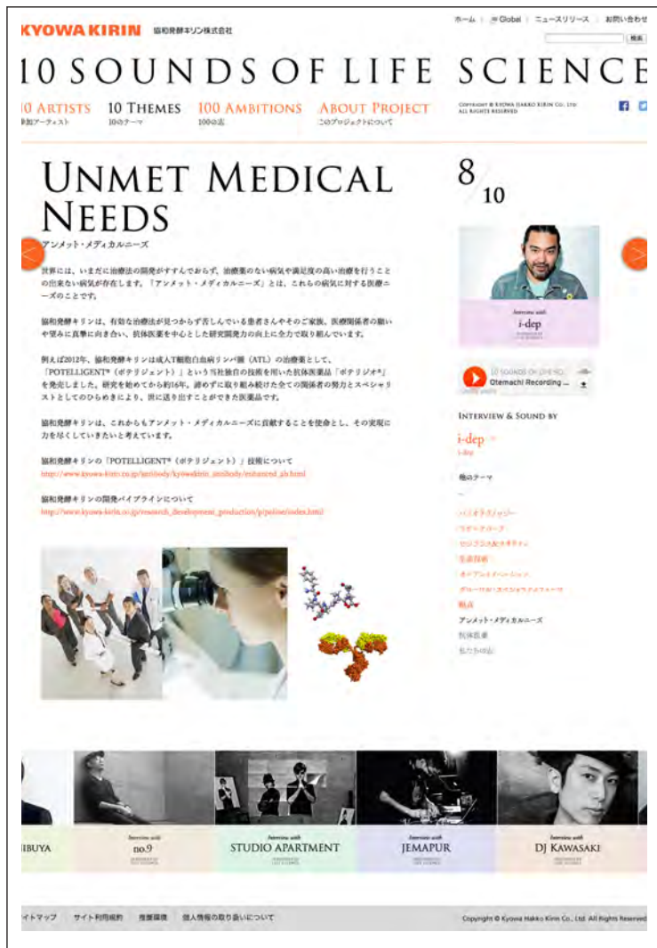
「10 THEMES」：各テーマの詳細をご紹介します。