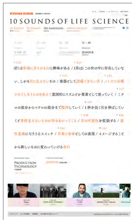
「100 AMBITIONS」：JEMAPURの10の言葉をお楽しみいただけます。