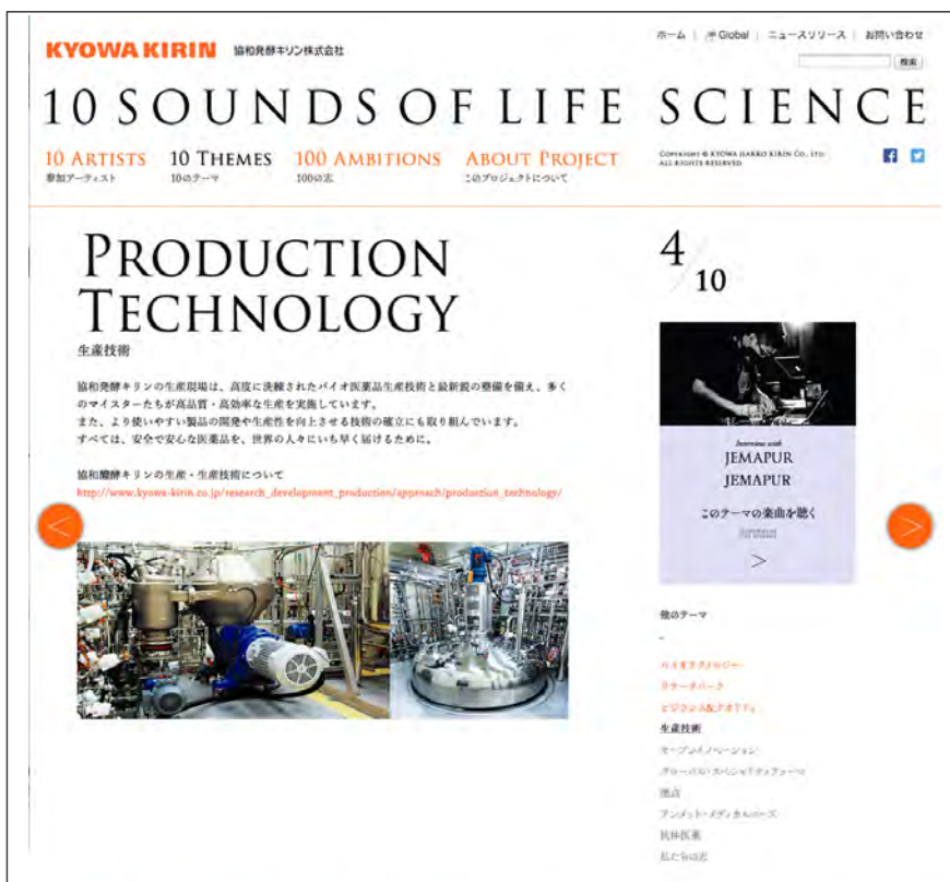
「10 THEMES」：各テーマの詳細をご紹介します。